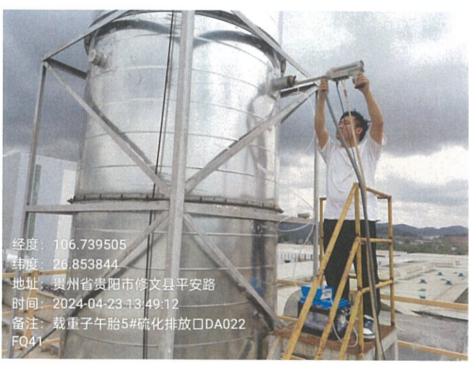
载重子午胎 5#硫化排放口 DA022FQ41