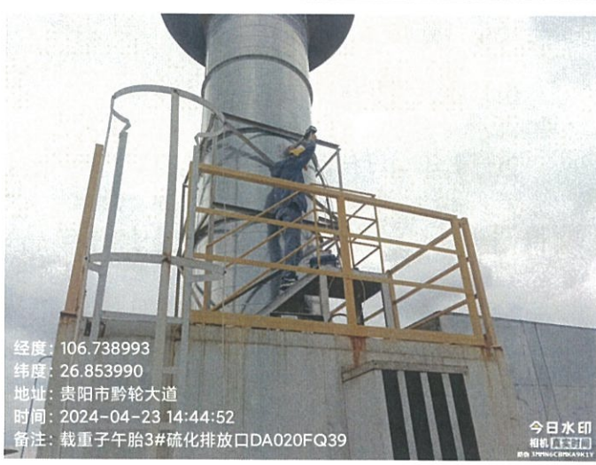
载重子午胎 3#硫化排放口 DA020FQ39