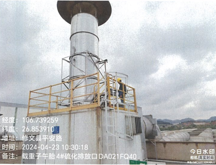
载重子午胎 4#硫化排放口 DA021FQ40