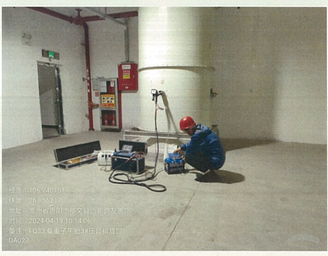
载重子午胎 3#压延排放口 DA027FQ33