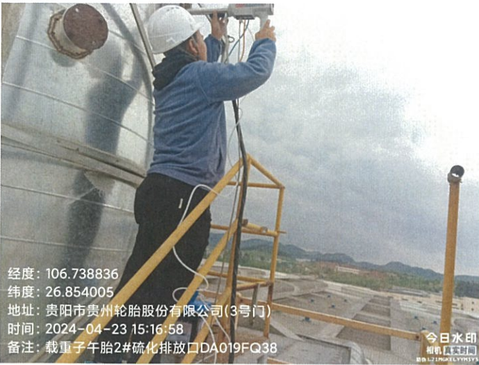
载重子午胎 2#硫化排放口 DA019FQ38