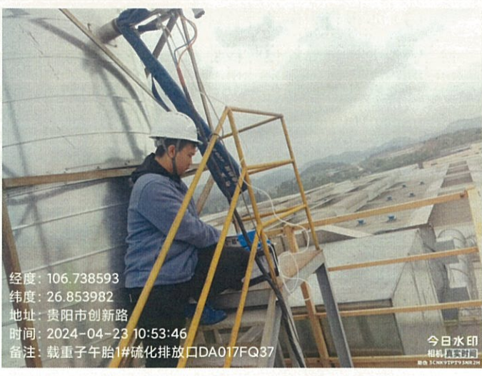
载重子午胎 1#硫化排放口 DA017FQ37