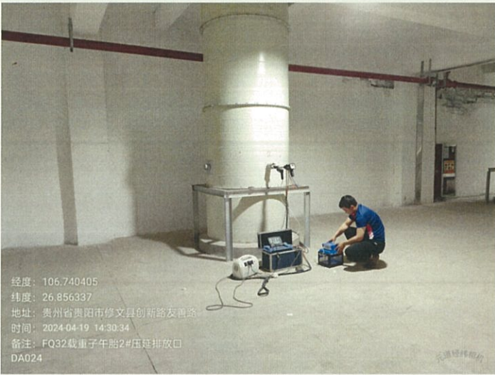
载重子午胎 2#压延排放口 DA024FQ32