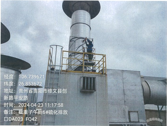
载重子午胎 6#硫化排放口 DA023FQ42