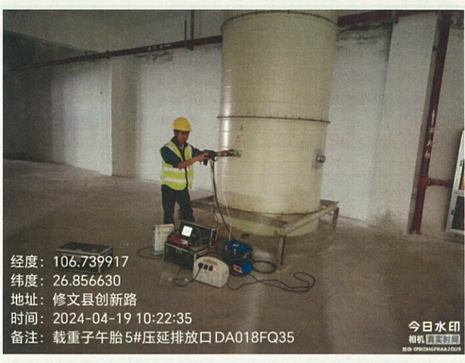
载重子午胎 5#压延排放口 DA018FQ35