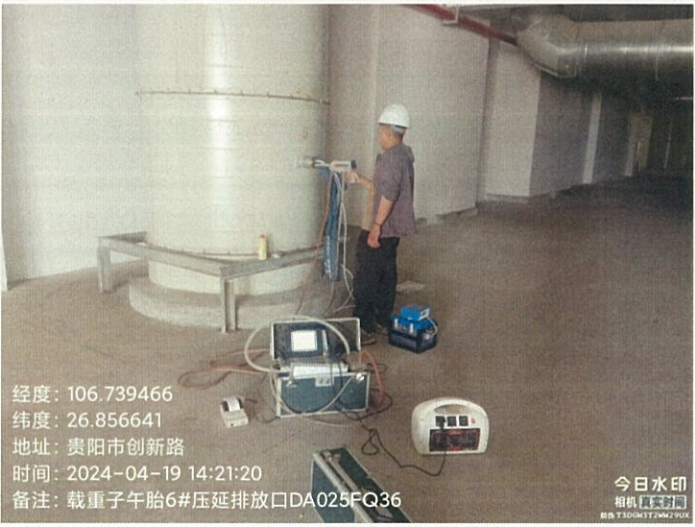
载重子午胎 6#压延排放口 DA025FQ36