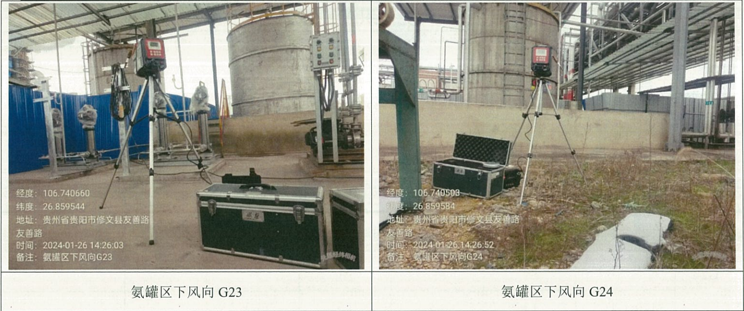
附：无组织监测点位示意图