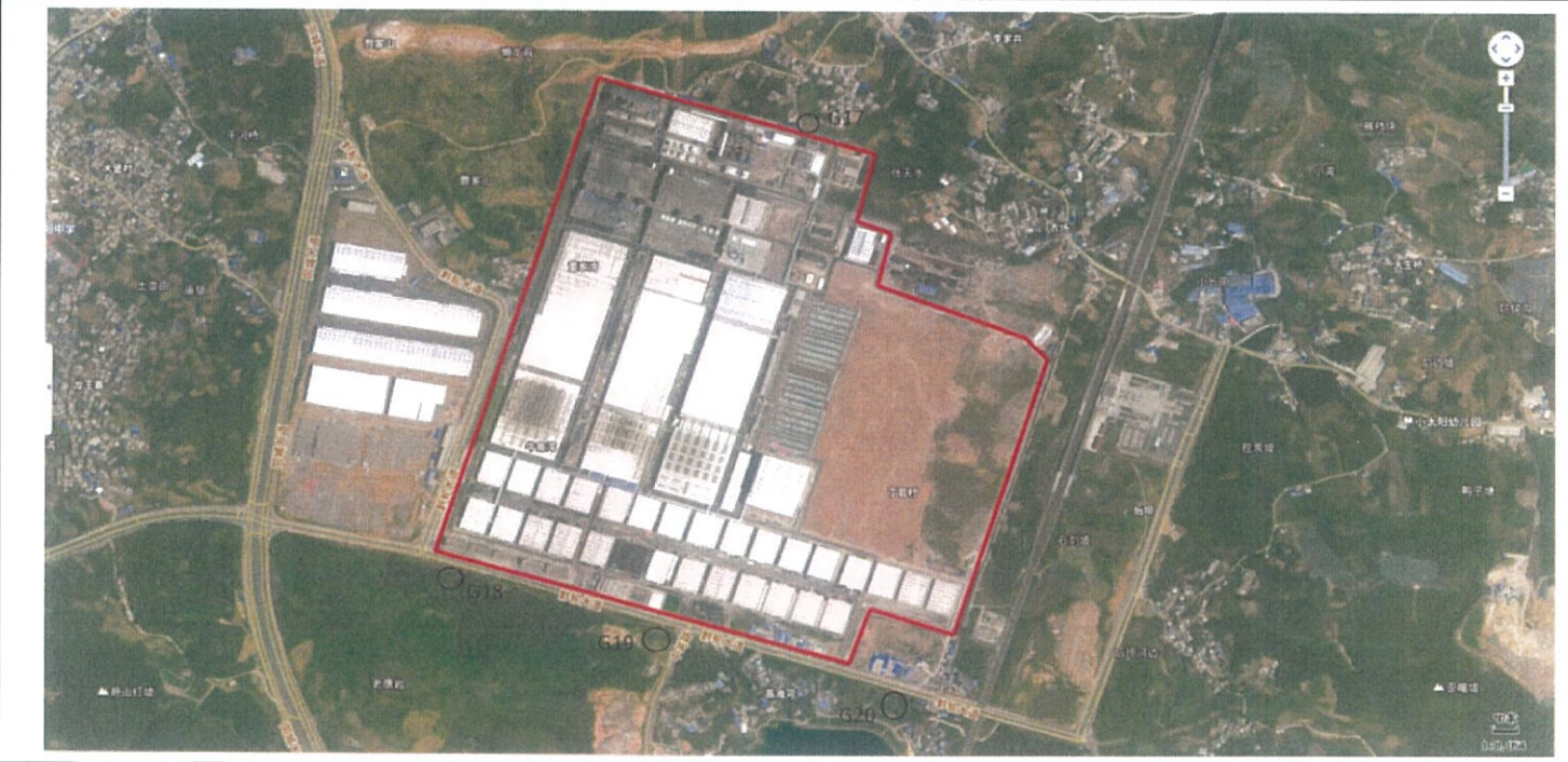
附：无组织监测点位示意图