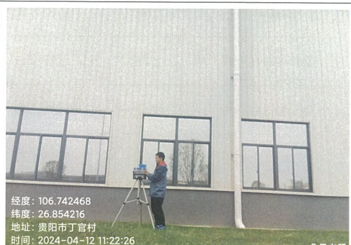
四期厂房成型窗外 G18