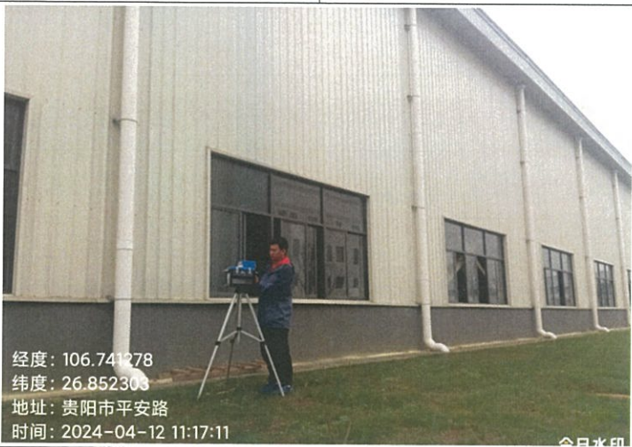
四期厂房硫化窗外 G19