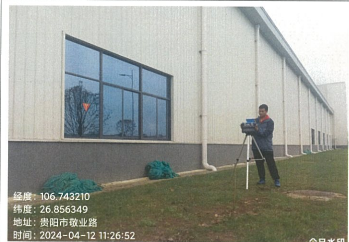
四期厂房压延窗外 G17