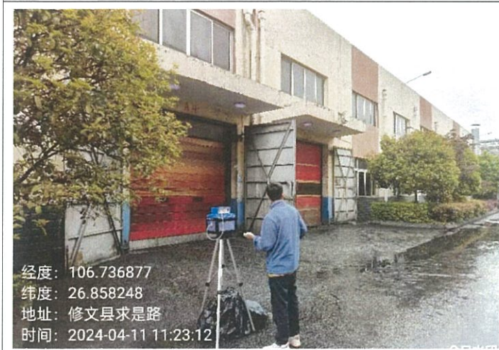
A 区大门 G7