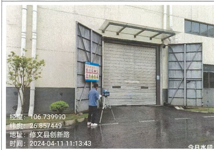
C 区大门 G5