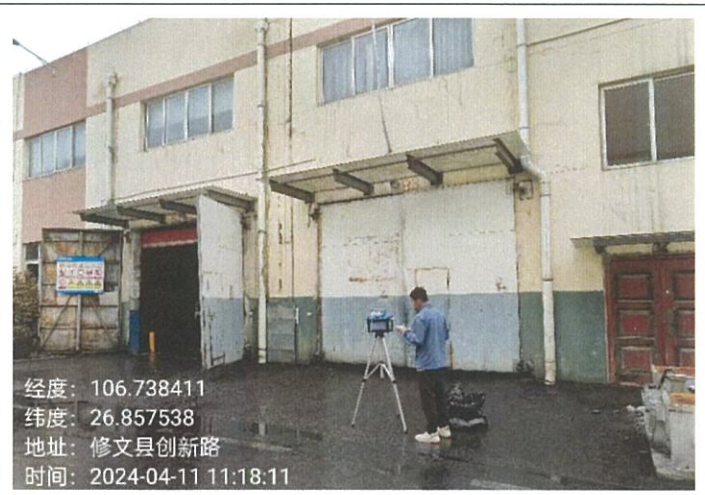
B 区大门 G6