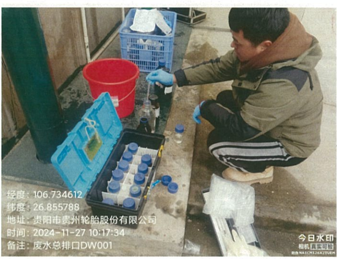
废水总排口 DW001FS1 废水总排口 DW001FS1（GPS）

2024 年 11 月 27 日对贵州轮胎股份有限公司 2024 年第四季度自行监测项目 进行现场采样。监测过程中对样品采取全程序空白样分析、现场平行样分析、实验室平行样分析、实验室空白样分析、质控样分析等质控措施。现场质控结果如表 6-1，平行双样分析精密度控制合格率情况如表 6-2，质控样或加标回收控制合格率情况如表 6-3。