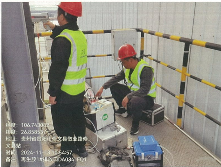
再生胶 1#排放口 DA034FQ1

2024 年 11 月 13 日对贵州轮胎股份有限公司 2024 年 11 月自行监测项目进行现场采样，2024 年 11 月 13 日进行监测分析。监测过程中采取运输空白样分析、实验室平行样分析、质控样分析等质控措施。现场质控结果如表 6-1，平行双样分析精密度控制合格率情况如表 6-2，质控样或加标回收控制合格率情况如表 6-3。