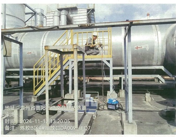
炼胶 B 区 4#排放口 DA009FQ7