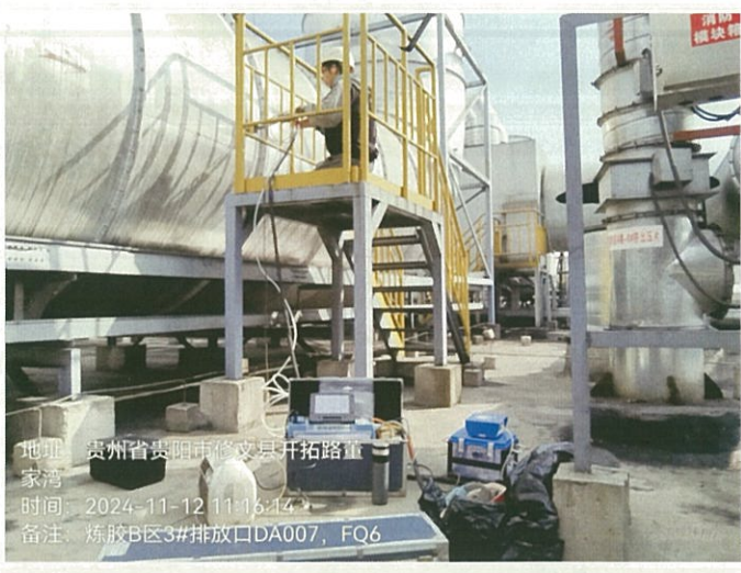
炼胶 B 区 3#排放口 DA007FQ6