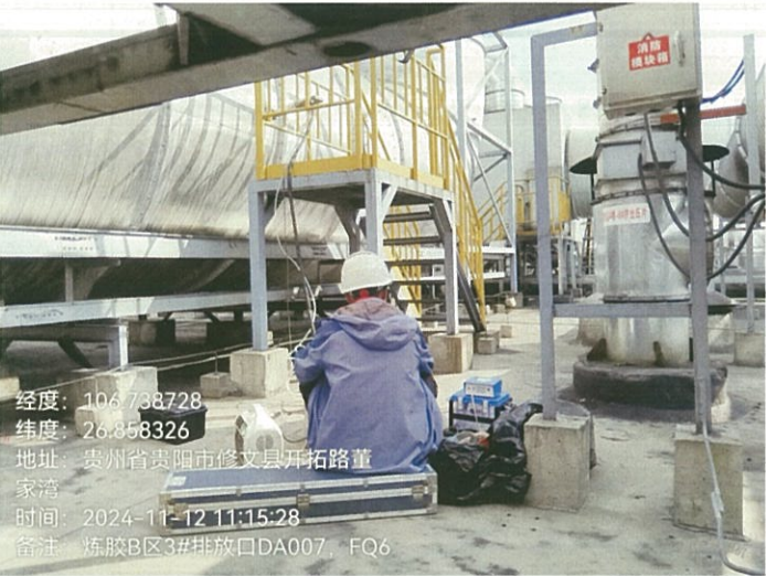
炼胶 B 区 3#排放口 DA007FQ6