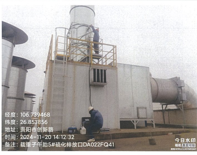
载重子午胎 5#硫化排放口 DA022FQ41