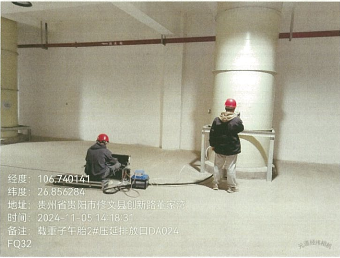
载重子午胎 2#压延排放口 DA024FQ32