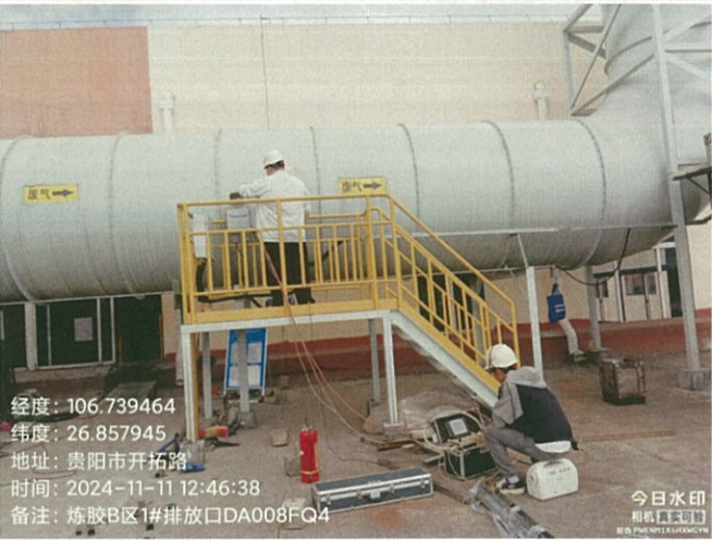
炼胶 B 区 1#排放口 DA008FQ4