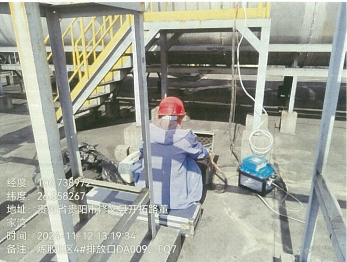
炼胶 B 区 4#排放口 DA009FQ7