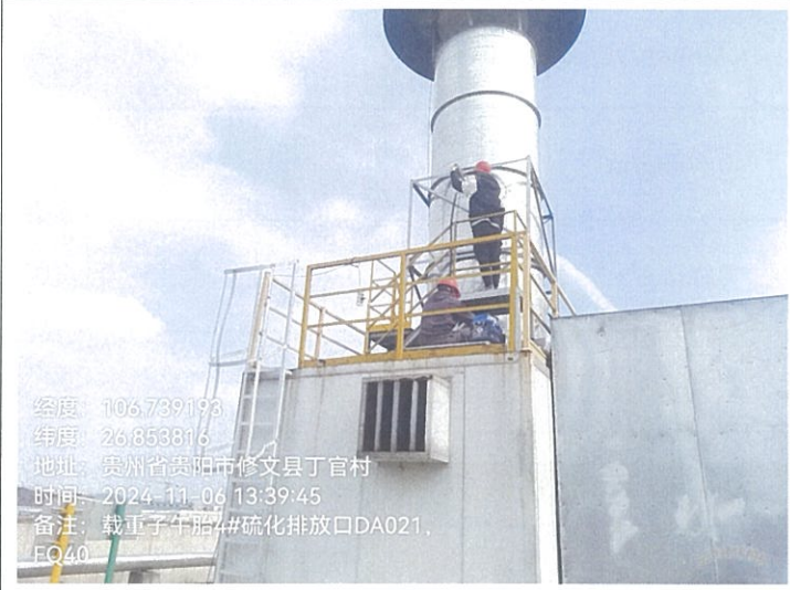
载重子午胎 4#硫化排放口 DA021FQ40