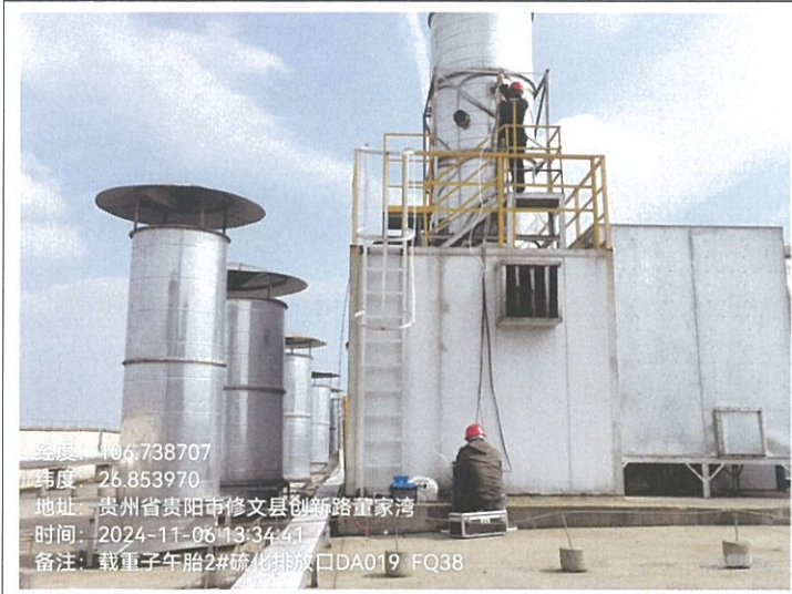
载重子午胎 2#硫化排放口 DA019FQ38