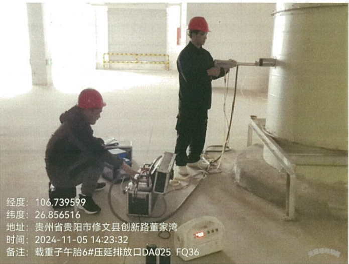
载重子午胎 6#压延排放口 DA025FQ36