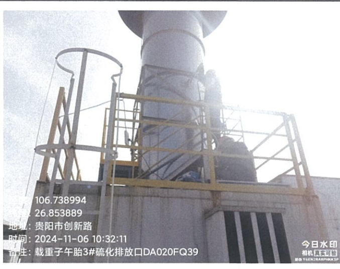
载重子午胎 3#硫化排放口 DA020FQ39