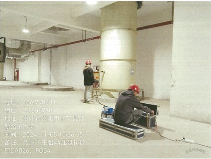
载重子午胎 4#压延排放口 DA026FQ34