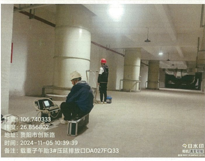
载重子午胎 3#压延排放口 DA027FQ33