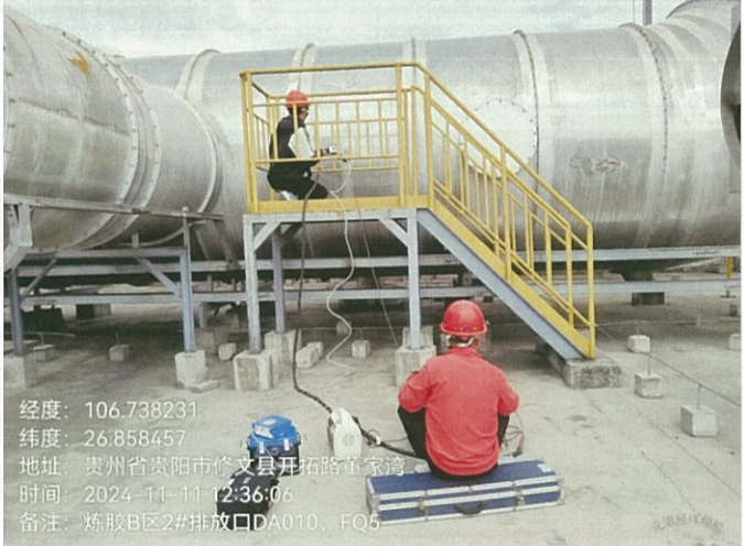
炼胶 B 区 2#排放口 DA010FQ5