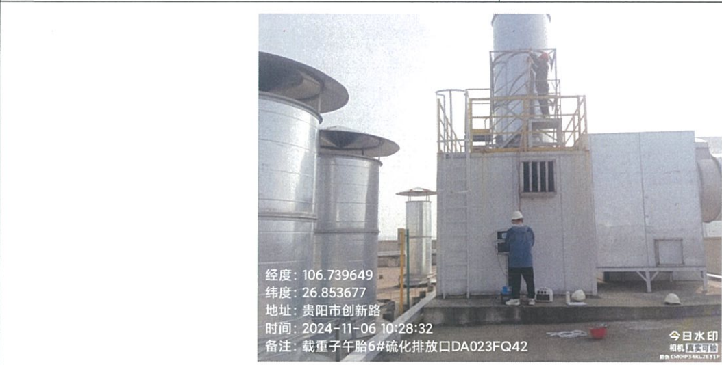
载重子午胎 6#硫化排放口 DA023FQ42