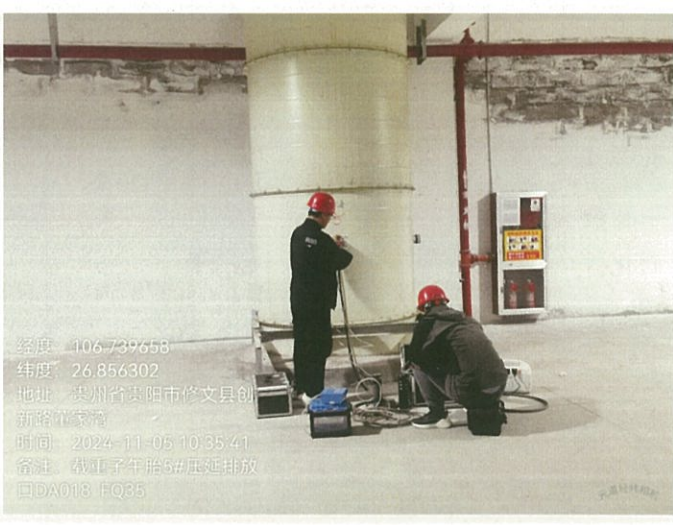
载重子午胎 5#压延排放口 DA018FQ35