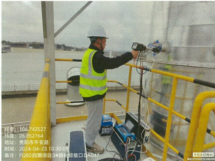
四期项目 3#硫化排放口 DA047FQ50