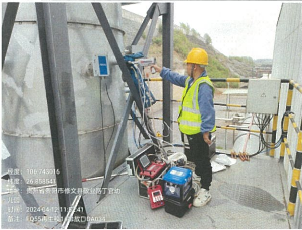
再生胶 1#排放口 DA034FQ55