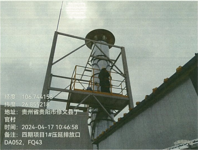
四期项目 1#压延排放口 DA052FQ43