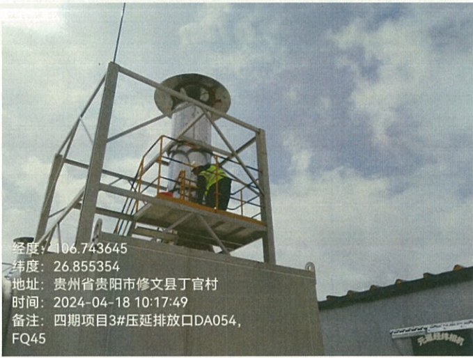
四期项目 3#压延排放口 DA054FQ45