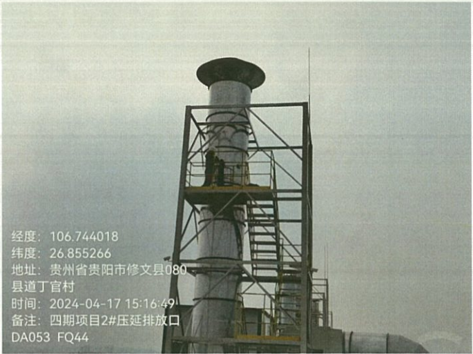
四期项目 2#压延排放口 DA053FQ44