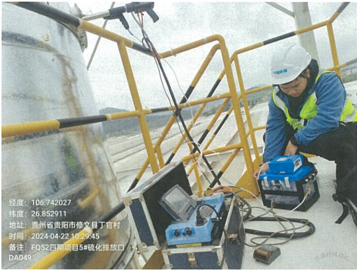
四期项目 5#硫化排放口 DA049FQ52

2024 年 4 月 17 日至 4 月 19 日、4 月 22 日至 4 月 23 日对贵州轮胎股份有限公司 2024 年第二季度自行监测项目进行现场采样。监测过程中对样品采取运输空白样分析、实验室平行样分析、实验室空白样分析、质控样分析等质控措施。现场质控结果如表 6-1，平行双样分析精密度控制合格率情况如表 6-2 质控样或加标回收控制合格率情况如表 6-3。