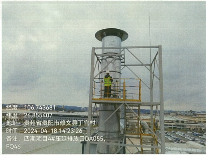
四期项目 4#压延排放口 DA055FQ46