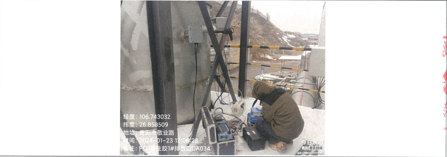
再生胶 1#排放口 DA034FQ1