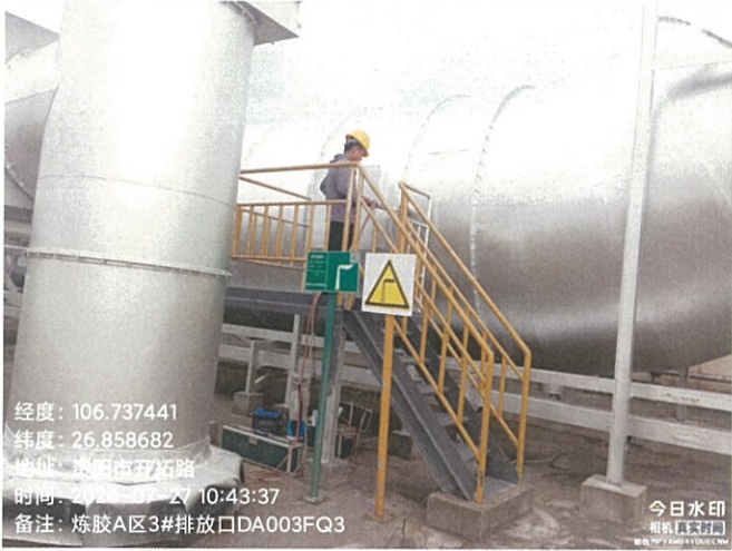
炼胶 A 区 3#排放口 DA003FQ3

2024 年 7 月 27 日、7 月 29 日对贵州轮胎股份有限公司 2024 年第三季度自行监测项目进行现场采样， 2024 年 7 月 27 日至 7 月 31 日进行监测分析。监测过程中对样品采取全程空白样分析、实验室空白样分析等质控措施。现场质控结果如表 6-1。